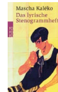
Das lyrische Steno- grammheft von Mascha Kaléko